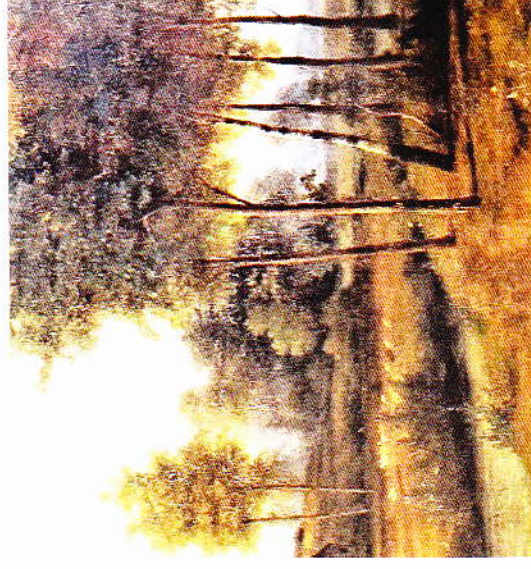
Detail uit schilderij nr. 3.

Geniet van de stilte en de harmonie van het Roerlandschap. De bankjes bij het museum en de Roer nodigen u uit tot een pas op de plaats en een moment van onbezorgd beschouwen van de ontluikende natuur.