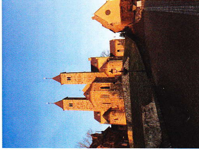
Basiliek en Mariakapel bij opkomende zon, febr. 2019

Zondag 17:00 u Gregoriaanse Vespers in de basiliek (tekstboekjes Latijn-Ned. beschikbaar) inleiding om 16:45 u.