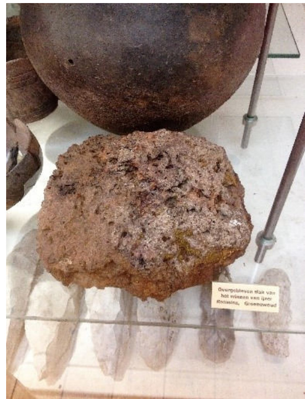
Romeinse ijzerslak van de Romeins villa in het Groenewoud