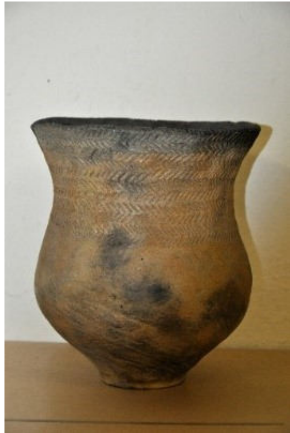
Grafbeker uit de Steentijd RMO

Als grafgift kreeg de dode een met touwindrukken versierde beker en een vuurstenen mes mee.