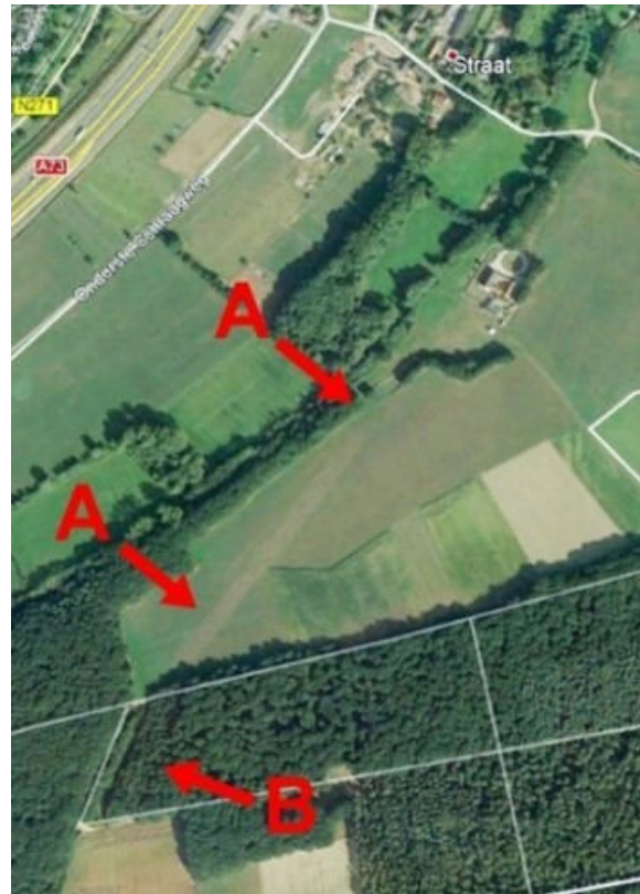
De Via Traiana is op een luchtfoto nog zichtbaar als een lichte streep in het landschap.

Al in 1840 heeft de Roermondse notaris Guillon de Romeinse weg in dit gebied ontdekt. Volgens hem was deze twaalf tot veertien voet breed (1 Rijnlandse voet is 31,4 cm) met een twee voet dikke grindlaag. De weg was toen bekend onder de naam Keizersbaan, Keizers- of Heksenweg. Nu is deze alleen nog herkenbaar als een langgerekte strook verploegd grind in de akkers.