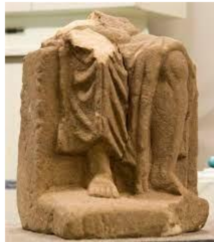
Foto: Beeldfragment van een tronende Jupiter te zien in het Roerstreek museum

Vermoedelijk heeft op een sokkel midden in 'Medericum' een beeld van de oppergod Jupiter - zittende op een troon - gestaan.