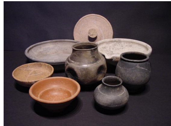
Foto: Romeinse vondsten (drinkbekers, kommen, borden, wrijfschaal en deksel) uit het grafveld aan de Akerstraat.

De Romeinen cremeerden veelal hun doden en begroeven de resten dan in de grond. Ook gaven ze hun doden vaak geschenken mee. Die grafvelden vinden we vaak langs een weg. Langs de Via Traiana zijn op verschillende plekken grafvondsten gedaan, zoals in Echt, Posterholt, Melick en Swalmen.