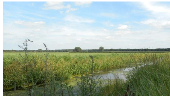
Foto: Zicht op het drassige Hohbruch nabij Schalbruch

De Annendaalderweg te Putbroek loopt over de rand van een hoogte langs een drassig gebied. Dat drassig gebied strekt zich uit van Putbroek, Echterbroek, Pepinusbroek, Haeselaarsbroek, Hohbruch, Schalbruch, Isenbruch, Millenerbruch, Schwienswei tot aan het Tüddener Fenn langs de Rodebach. Dit uitgestrekt moerassig gebied zorgde wellicht voor een natuurlijke barrière en zo tot bescherming van de vicus Tüddern tegen aanvallen vanuit het zuiden en westen.