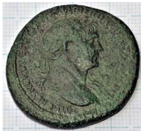
Foto: Sestertius munt gevonden nabij Putbroek