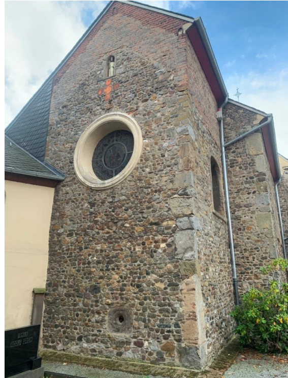
Foto: De achterzijde van de kerk te Millen. In de nok onder het beeld van St. Nikolaas zijn rode ronde Romeinse sokkelresten verwerkt.

Ga bij de splitsing in de bebouwde kom van Tüddern linksaf over de Millener Weg. Ga bij de Sittarder Straße linksaf via de straat Zur Westzipfelhalle. Aan de rechterzijde ligt Nahversorgung Tüddern met de Westzipfelhalle aan In der Fummer. Hier eindigt de terugweg (19,9 km) van fietsroute 1 Putbroek-Tüddern bij de Westzipfelhalle te Tüddern. De totale lengte van fietsroute 1 heen en terug bedraagt 34,7 km.